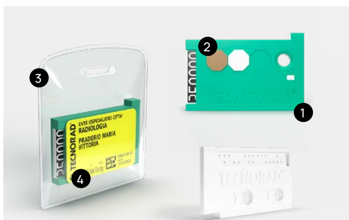
Immagine a scopo illustrativo. NON aprire l'involucro